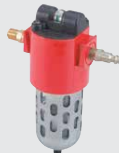
Juego de filtración de aire