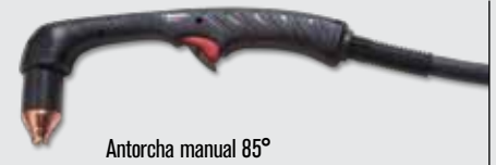
Antorcha manual 85°