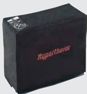
Cubierta contra el polvo para el sistema