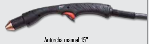
Antorcha manual 15°