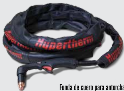
Funda de cuero para antorcha